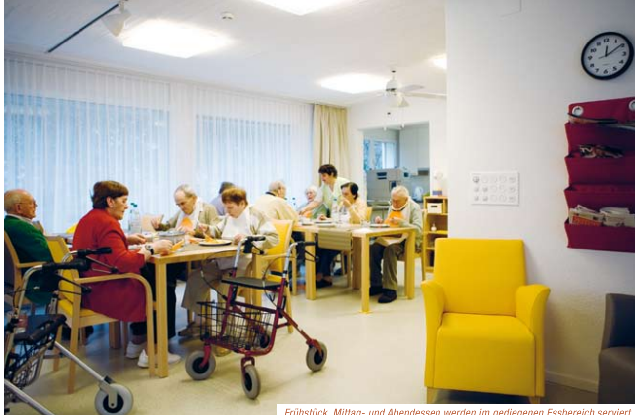
Frühstück, Mittag- und Abendessen werden im gediegenen Essbereich serviert.