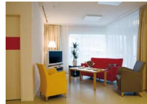
Die gemütliche TV-Ecke lädt zum Verweilen ein. Hier wird geplaudert, Musik gehört oder gelesen.